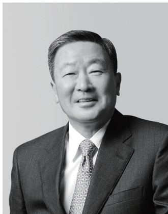
Koo, Bon Moo Chairman of the Board 구본무 이사회 의장 (주)LG 대표이사 회장